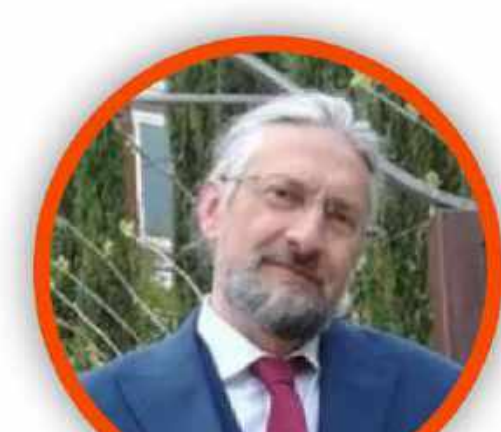
MASSIMO TAVOLA SECONDARIA DI PRIMO GRADO